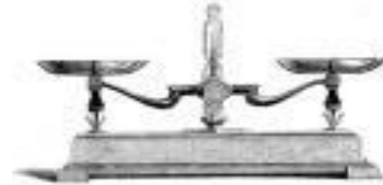
ميزان الكفتين (ميزان روبرفال Roberval)